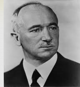
Edvard Beneš prezident

Prevzal prezidentské kreslo práve po E. Benešovi, ktorý abdikoval