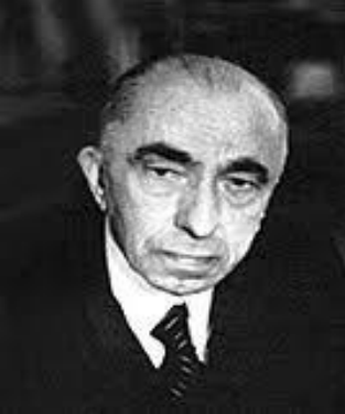
Emil Hácha prezident

Prevzal prezidentské kreslo práve po E. Benešovi, ktorý abdikoval