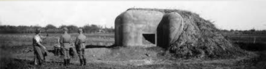
Bunkre a betónové opevnenia