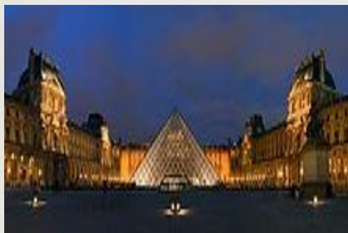
Louvre múzeum v Paríži