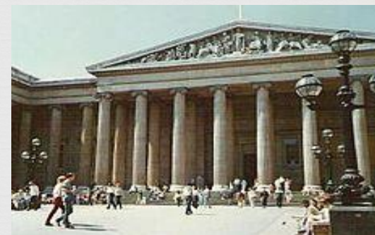
Britské múzeum v Londýne