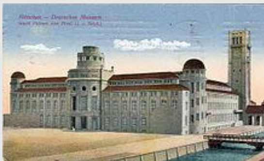
Technické múzeum v Mníchove